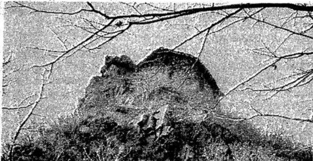
Отшелническата обител на скалата край останките от крепостта Урвич, където меценатът живееше без електричество и без вода

вам и следта от огорчение. А знам какво е погрешно да се издигне домът на изкуствата.